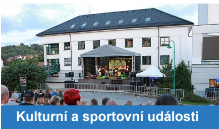
Kulturní a sportovní události

Přihlášením k odběru hlášení dává registrovaný občan souhlas se zpracováním poskytnutých osobních údajů za účelem zaslání aktuálních informací z města. Více informací o rozsahu a účelu zpracování a odvolání souhlasu najdete na adrese www.bystricenp.hlasenirozhlasu.cz nebo osobně na městském úřadě.